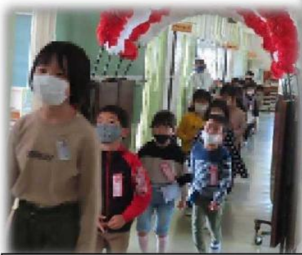
1年生は、6年生の先導で、放送室前へ