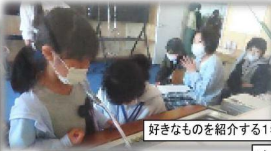
好きなものを紹介する1年生(放送室)