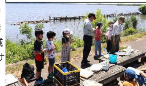
「環境学習ボランティア(「はちろうプロジェクト」の方々)」 4年生の総合的な学習で。体験的な活動。