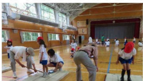
「スポーツテスト測定ボランティア」全校で実施。 (〇〇さん、〇〇さん、〇〇さん、〇〇さん)