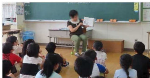
「読み聞かせボランティア(「おはなしポケット」の方々)」 毎月1回、朝の時間、全学級で。

こんな時代だからこそ、学校と地域、保護者が互いに協力し、未来の地域の宝である子どもたちの成長を、一緒に支えていくことが大切だと感じております。出戸小では地域のボランティアさんの力をお借りして、これまでもずっと教育活動をすすめてきました。本当にありがたいことです。この支え合いが深まり、地域の子どもたちを地域で遠慮なく褒めたり叱ったりして育てていける時代が来ればいいなと思っています。また、地域のために学校ができることはないか、協力していただけて、地域に貢献することを、今後も考えていきたいと思っています。