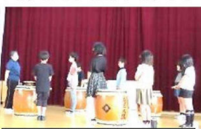
「出戸蒼海太鼓クラブ指導ボランティア」 (〇〇さん) 4～6年生の希望者。