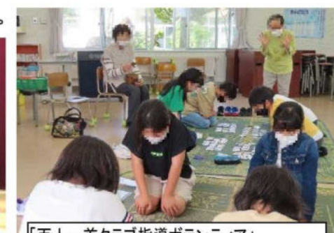
「百人一首クラブ指導ボランティア」 (〇〇さん、〇〇さん) 4～6年生の希望者。