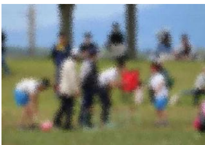
5・6年生「鉄人レース ツライアスロン」