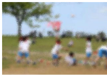
1年生「じよいふる玉入れ」