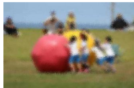
1・2年生「巨大たまごを運べ」