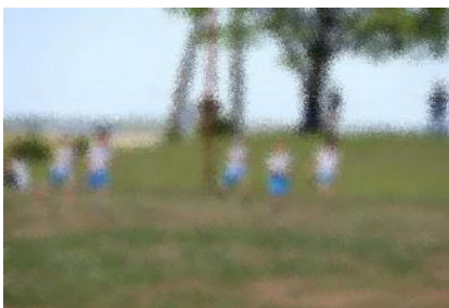
「徒競走」ゴール目指すぞ!

本当にそう思います。この宝物にさらに磨きをかけて、より輝かせるよう努めて参ります。