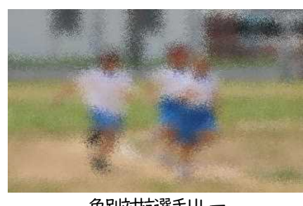
色別対抗選手リレー