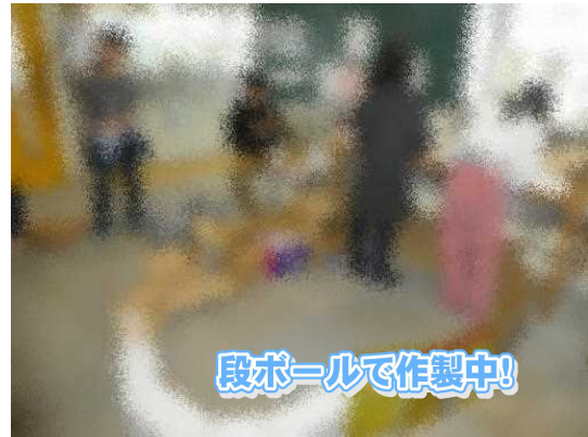
段ボールで作製中!