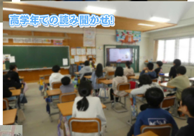
高学年での読み聞かせ!