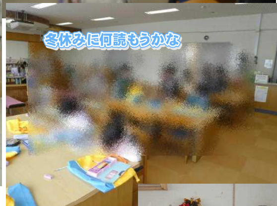
冬休みに何読もうかな