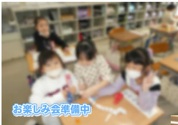
お楽しみ会準備中