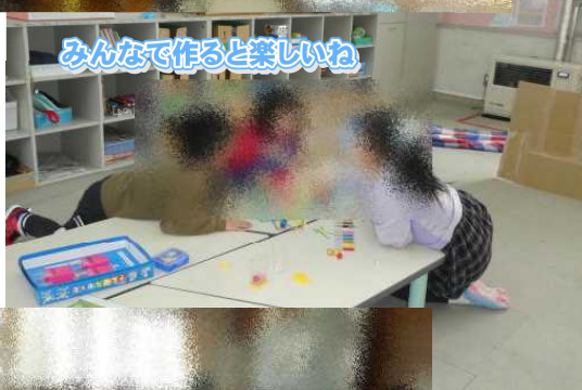
みんなで作ると楽しいね