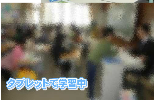
タブレットで学習中

来年も元気な子どもたちとともに、職員一同支援してまいります。良いお年をお迎えください。