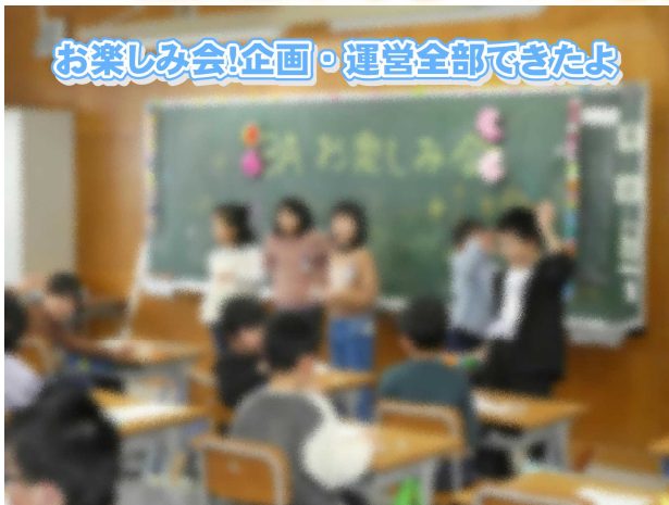
お楽しみ会!企画・運営全部できたよ