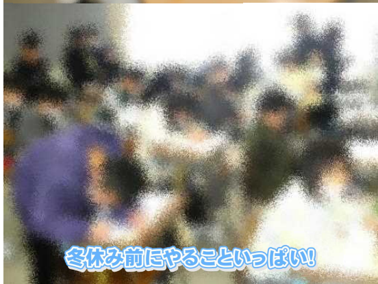
冬休みにやることいっぱい!