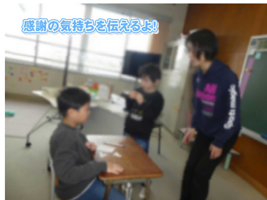
感謝の気持ちを伝えるよ!