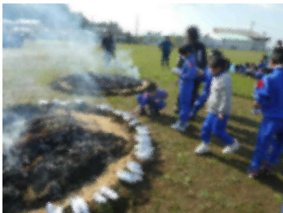
③アルミホイルで包んだサツマイモを、炭の周りに置きます。