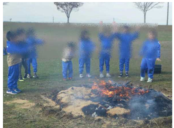
④「おいしくなあれ」と魔法をかけます。