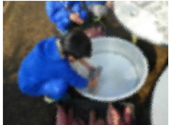
②水に濡らして、アルミホイルで包みます。