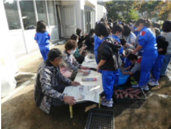
①サツマイモを新聞紙で包みます。

11月2日、晴天の下、1・2年生の焼き芋パーティーが行われました。みよし会の方々にお手伝いしていただき、本格的な焼き芋ができあがりました。「ドンキホーテの焼き芋みたい」という子どももあり、お店で出してもよいほどのおいしい焼き芋ができました。また、焼いている時間を利用して、畑近くにある小屋の扉もあっという間に修理していただきました。みよし会の皆様、たくさんのご協力ありがとうございました。