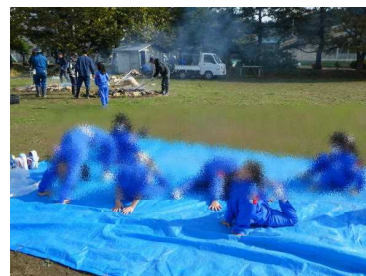
⑤焼き芋を待っている間にゆっくり「秋」を満喫しました。