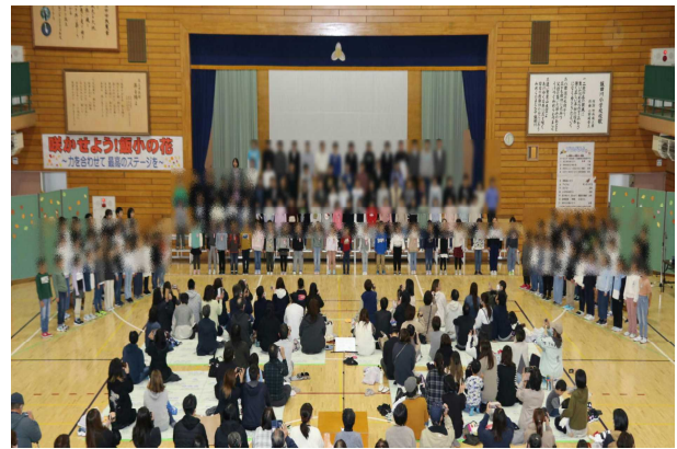
4年ぶりの全校合唱