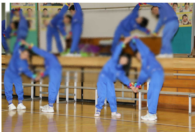
1年生「おおきなさつまいも」