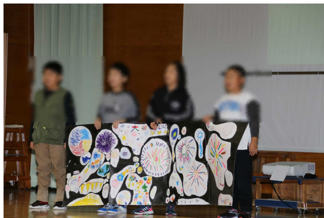
4年生「あきたびじょん～ふるさとのよさ、再発見～」