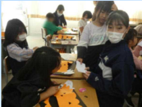
2年生の工作の学習の支援

これまで過ごしてきた小学校での学校生活や行事を違う視点で捉えることができた4日間でした。