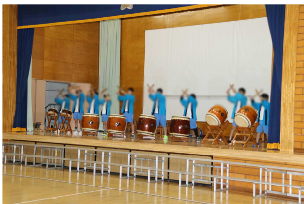
オープニングは、和太鼓クラブ！