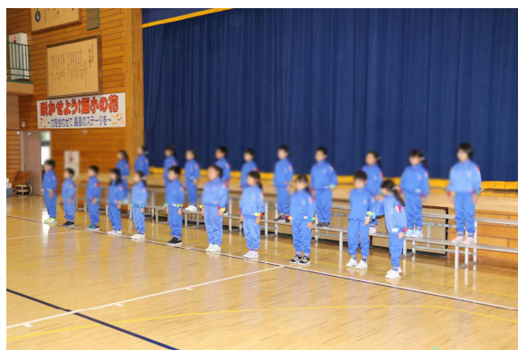
1年生のはじめのあいさつ