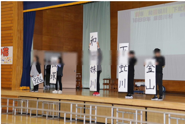
6年生「見つめよう、伝えよう 飯田川の魅力」