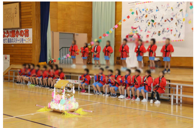
3年生「いのちのまつり」