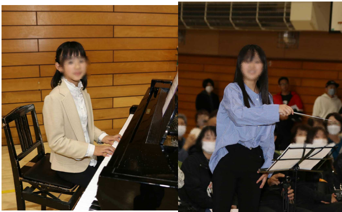
「校歌」のピアノ伴奏と「ふるさと」の指揮は6年生