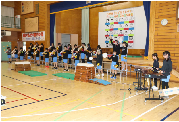
5年生「ひびけ! おどれ! とべ! GOGO 5年生」