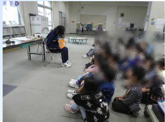
1年生では読み聞かせも!