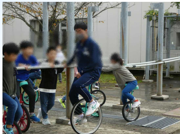
休み時間は、子どもたちと一緒に