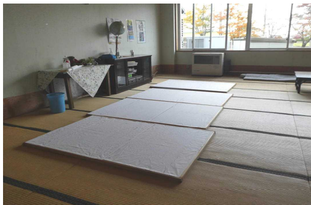
和室の障子を張り替えていただきました。 ボランティアの皆さんありがとうございました。