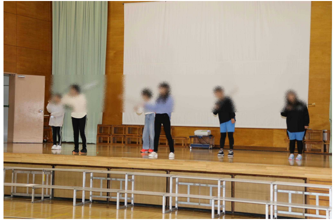
ダンスクラブは「アイドル」に合わせてDANCE!