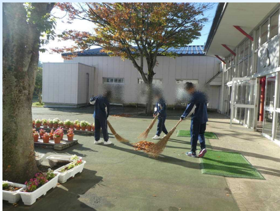
さわやかな挨拶と枯れ葉集め