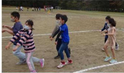
エア自転車でコースを回る3年生