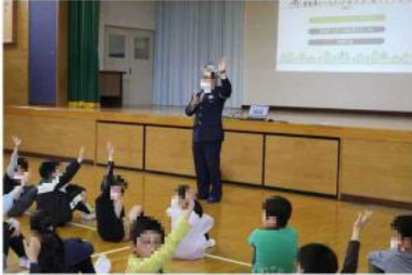
おまわりさんの質問に挙手する5年生

ご家庭でも、お子さんの登校や外出の際は、交通ルールを守るように声掛けをお願いします。