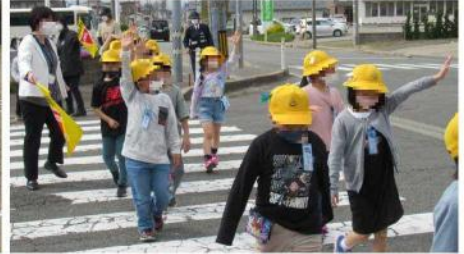
左右の確認をして横断する1年生