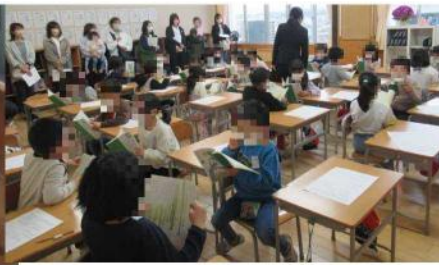
2年国語科「ふきのとう」の一場面