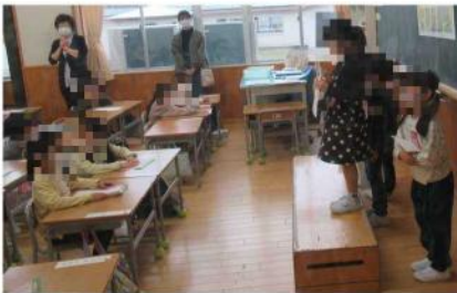
緊張しながら自己紹介する1年生