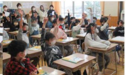
「はい。」と元気に挙手する5年生