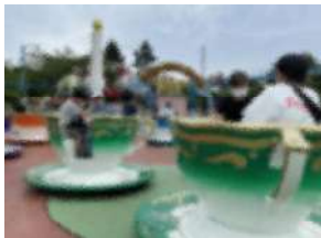
【ベニーランドにて】