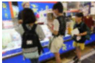
【楽しい買い物タイム】