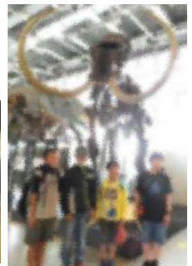
【東北大学総合学術博物館】