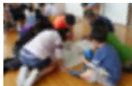
【もじさがし・こちらも必死】