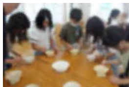
【まめつかみ・真剣なまなざし】

「本物はだれだ」「じゃんけんクエスト」「めざせ！あく力合計100kg」「まめつかみ」「もじさがし」「ピラミッドジャンケン」「輪なげ」の7つのゲームに全校の子どもたちが挑戦しました。また、今回は廊下にクイズもあり、より楽しい集会となりました。