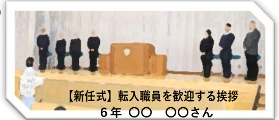
【新任式】転入職員を歓迎する挨拶 6年 OO OOさん

また、その翌日の入学式では、28名の1年生が元気いっぱいの返事とはつらつとした姿を見せてくれました。大豊小の嬉しい春です。