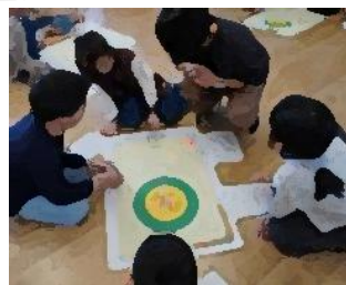
【3年生】算数の勉強楽しいなあ！