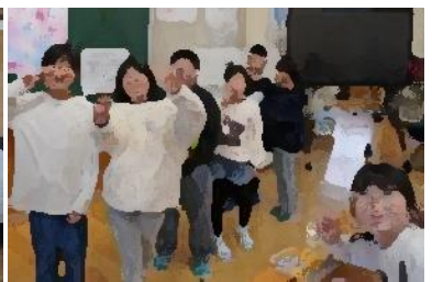
【4年生】新しい教室でピース！