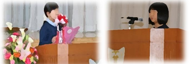
【入学式】あたたかい歓迎の言葉 6年 OO OOOさん