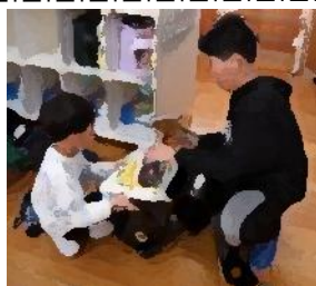
【1・6年生】6年生と一緒に なら大丈夫！