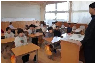
【2年生】授業前の挨拶。背中ピン！