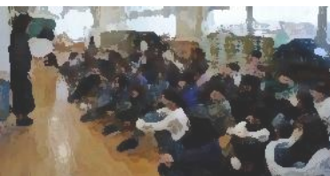
【高学年集会（5・6年）】 みんなで大豊小の お手本になろう！