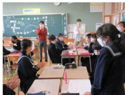
3人のALTと会話を楽しむ2年生