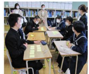
ほぼ2年ぶりの授業参観