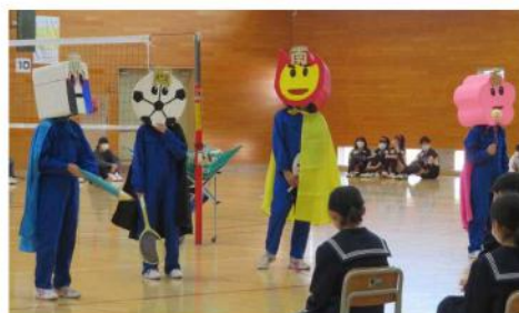
4 S 隊が南中生を激励