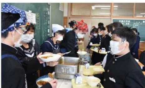
中学校最初の給食はカレーでした