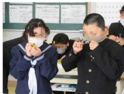
目を輝かせて花を観察する1年生