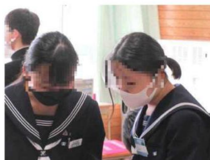
笑顔で意見を交換する3年生