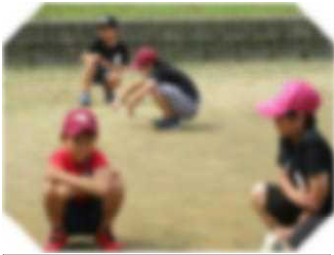
休み時間でも落ち着いて行動できました。

9月2日(金)に避難訓練を行いました。今回は、休み時間に火災が発生したと想定しての訓練でした。教室にいる子ども、廊下やホールで遊んでいる子ども、前庭やグラウンドを走り回っている子ども、思い思いに楽しんでいるそのとき、サイレンが鳴り、放送が流れました。