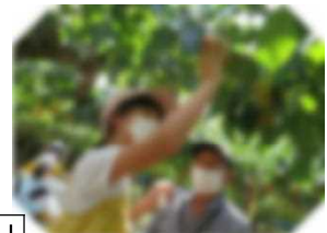
「おいしい梨はこれかな。」

最後に、おいしい梨の見分け方を教わり、梨狩り体験もしました。梨は大事に持ち帰りました。