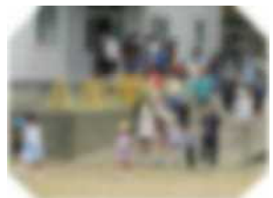
放送の指示で各階ごとに避難しました。

いつ・どこで避難する事態に見舞われるか分かりません。自分の命を守る行動について、ご家庭でも話題にしていただければありがたいです。