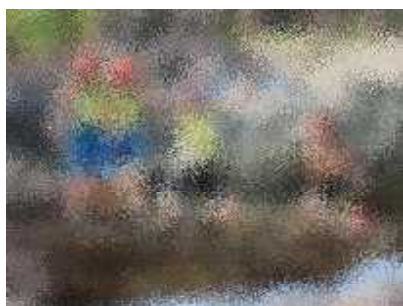
岩からの飛び降りも楽しい！