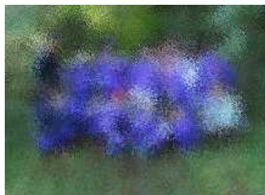
留山のガイドさんと一緒に。