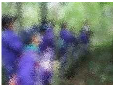
ブナの根を守るための遊歩道の上で。