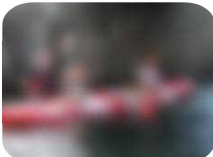
「息を合わせて！」シーカヤック体験。