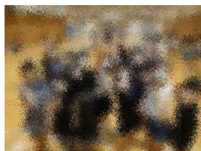
夜のつどいは大盛況！