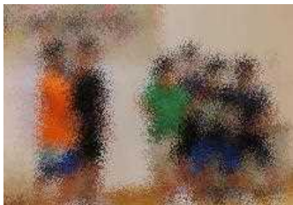
夜のつどいでは劇や手品などを披露！