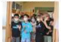
手を振って見送り

幼稚園で見たときよりみんな大きくなっていました。ぼくのことを覚えている人もいて、うれしかったです。ゲームでいろいろな人と交流して楽しめました。(松組 男子)