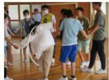
仲良く手をつないでフラフラリレー