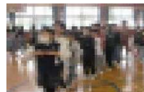
3年生：ジャンケン列車でGo!

東湖小学校のみなさんからは、学校のシンボルでもあるキバナコスモスの種をいただきました。来年の家庭は、ヒマワリの黄色とキバナコスモスのオレンジ色で、華やかになりそうです。