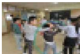
1年生：フラフラプでなかよしリレー

読み聞かせ会の前の約20分間、来校した東湖小のみなさんと学年ごとにミニ交流をしました。各学