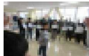
4年生：震源地は誰だ?

幼稚園以来久しぶりに会ったら、名前と顔が合わないくらいに大人っぽく成長していて、びっくりしました。