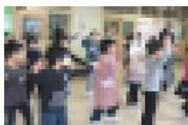
2年生：レッツ ダンス ダンス!

初めは緊張していたけれど、ゲームをしているうちに話ができて、すぐに仲良くなりました。