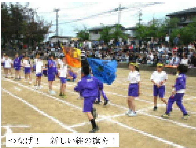
つなげ! 新しい絆の旗を!