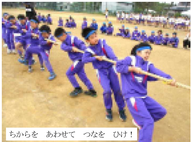
ちからを あわせて つなを ひけ!