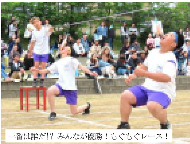
一番は誰だ!? みんなが優勝! もぐもぐレース!