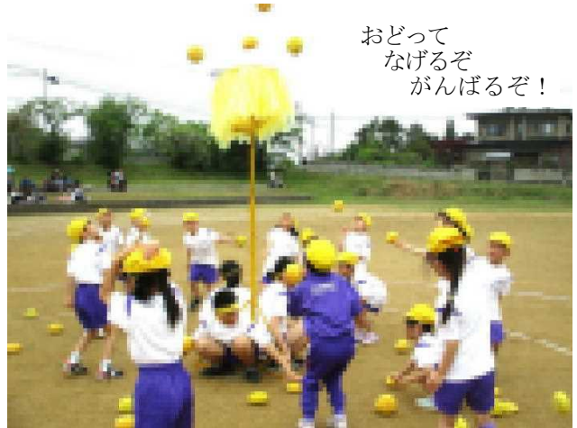
おどって なげるぞ がんばるぞ！