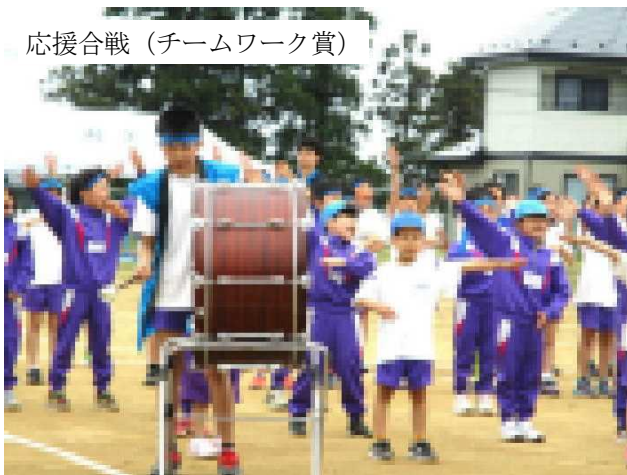
応援合戦（チームワーク賞）