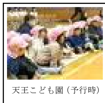
天王こども園（予行時）