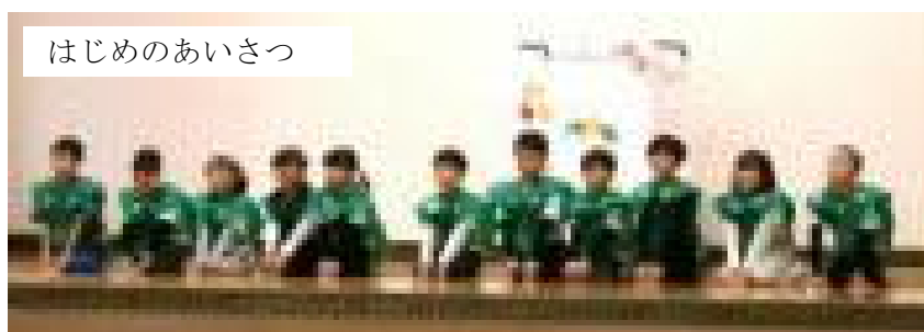
はじめのあいさつ