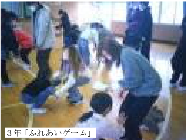
3年「ふれあいゲーム」

各学年の学級役員の方々が中心となって計画した親子レクリエーションが行われ、親子で楽しい時間を過ごしました。運営に関わってくださった役員の皆様、参加してくださった保護者の皆様、ありがとうございました。