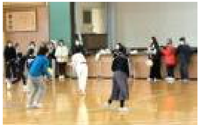
5年「王様ドッジボール」