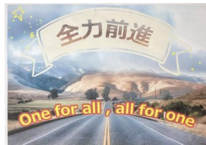
左写真：3年生の教室前面に掲示している学年目標（スローガン）

各教室には、生徒と教員とが学年目標を共有しやすいように、スローガン（赤い囲み線の中）を設定して掲示しています。