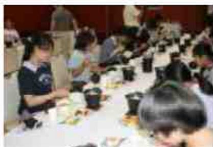
ホテル花巻での夕食は、超がつくほど豪華 「食べきれない」と言いながらパクパク