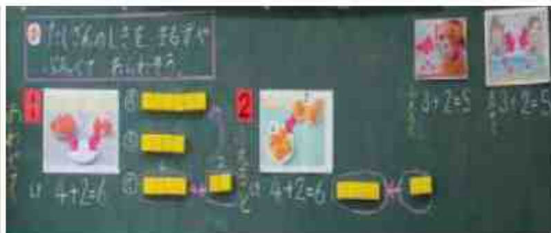
<1年生「たしざん」の学習のノートと、授業の板書>

「ふえると」という言葉に着目し、「あわせて」との違いを、ブロック操作しながら考えました。その後、「まるず」にし、矢印の向きをどのように表せばよいかを考えて書いています。思考の跡がしっかりと見えます。ひらがなを習ったばかりの1年生が、これほどまでに上手にかけようになっていることにも驚きです。