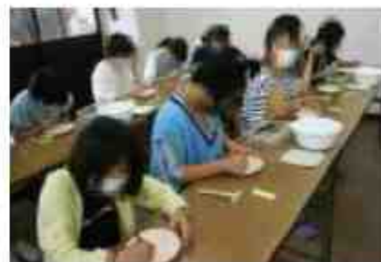
盛岡手作り村で、絵付け体験 1~2ヵ月後、焼き上がり次第届くそうです