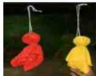
天気予報を覆す「晴れ」は、カラフルでてるてる坊主のお陰かな

6月28日、29日の二日間、6年生が岩手県へ修学旅行に行ってきました。新型コロナウイルス感染症のため、この三年間は秋田県内の修学旅行でしたが、様々な条件が整い、実現しました。二日間を通して、子どもたちの笑顔とよいところがたくさん見られた、大変充実した修学旅行だったと思います。6年生にとって最高の思い出となったにちがいありません。快く送り出してくださった保護者の皆様に、心より感謝を申し上げます。