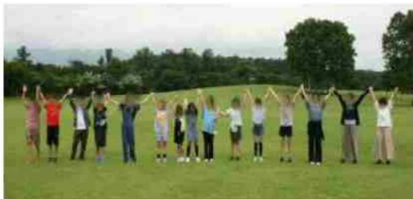
小岩井農場でばんざーい！！