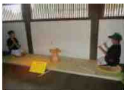
えさし藤原の郷で、 平安の遊び「つぼうち」に夢中