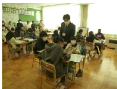
6年生 国語科「海のいのち」

PTA全体会 … PTA会長の〇〇さんより閉校記念事業実行委員会についてのお話がありました。また、校長からの話として、1/26付で配付している保護者アンケートの結果について、改めて、次のこととお話ししました。