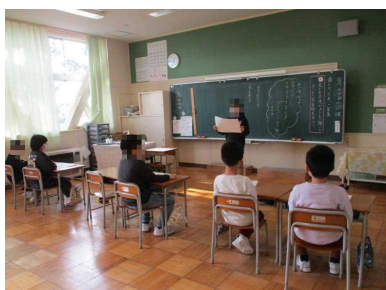
2年生 国語科「楽しかったよ2年生」