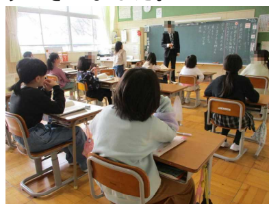
3年生 道徳科「ゆめに向かって」