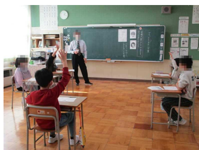
4年生 道徳科「ブラッドレーのせい求書」