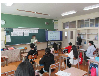
5年生 総合的学習の時間「6年生へステップアップ」