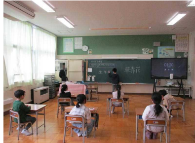
1年生 生活科「もうすぐ2年生」

2月14日、今年度最後のPTA授業参観と全体会、学級懇談を行いました。保護者の皆様にはご多用の中、たくさんのご出席をいただき、ありがとうございました。