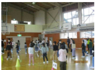
5年生企画の王様じゃんけんは大盛り上がり