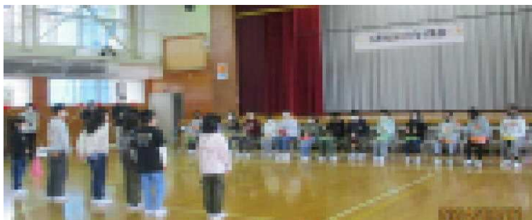
4年生からは、素敵な歌のプレゼント