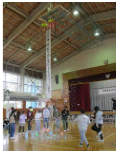
くす玉割り「中学校での活躍を願っています」