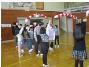
6年生が、1年生と一緒に入場 花のアーチと体育館の飾り付けは、 3年生が担当しました

3月1日、「6年生ありがとう集会」を行いました。5年生が中心となって企画・運営し、学年ごとに分担していろいろな準備を進めました。1年生から5年生が、今までお世話になった6年生に感謝の気持ちを込めてメッセージを送ったり、歌を歌ったりしました。会場全体が笑顔にあふれ、とても楽しく心温まる集会でした。