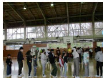
1年生と6年生が、一緒にボール送り