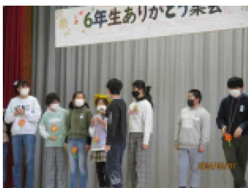
王様一番乗りは〇〇さん