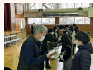
子どもたちから 感謝のメッセージカード