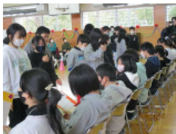
縦割り班から感謝のメッセージカード