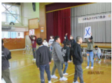
6年生からの学校〇×クイズ