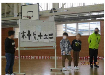
2年生は、6年生に漢字クイズ