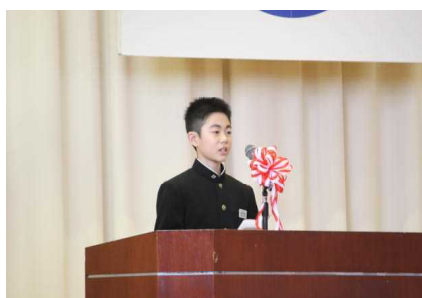
【新入生代表誓いの言葉】