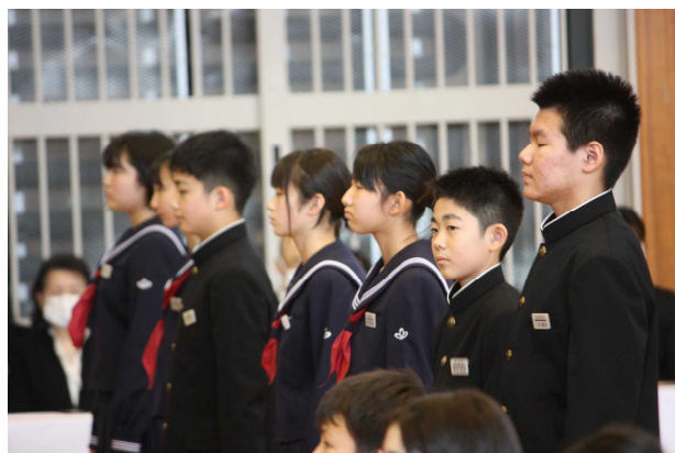
【入学式での1年生の様子】