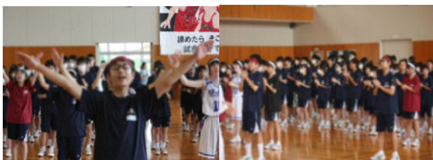
【互いに仲間の健闘を願いました】