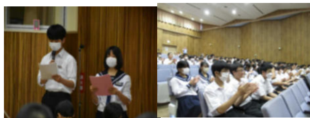
視聴覚ホールで行われた羽城祭集会】

合唱に関しては、先月から学級の合唱曲の選定や伴奏者、指揮者の決定を行い、授業を活用して、どのクラスも一生懸命練習を積み重ねています。学年合唱の練習も行いながら、生徒たちの意欲も徐々に「羽城祭」モードになりつつあります。生徒、職員、PTAの知恵と協力で大いに羽城祭を盛り上げ、成功させましょう。