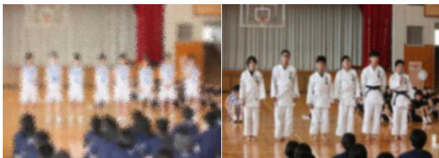
【県総体に対する強い思いが感じ取れました】

今年度の県中総体スローガン『栄光に向かって 我らの闘魂 咲き誇れ』を目指して、県下の中学生が競い合う、大きな大会です。出場する選手のみなさんは、羽城中生としてだけでなく、男鹿潟上南秋地区の代表として、これまで頑張ってきた自分たちの力を信じ、悔いのない試合をしてきてほしいと思います。