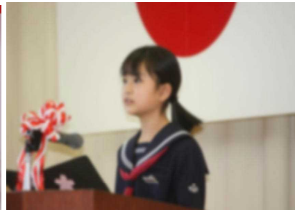
【新入生代表誓いの言葉・〇〇 〇〇さん】