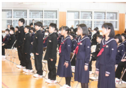
【入学式での1年生の様子】

4月5日(金)、まだ肌寒さが感じられるなかにも例年になく早い春の訪れを感じさせる佳き日に、ご来賓の方々と保護者の皆様をお迎えして、令和6年度第76回入学式を厳粛かつ整然と執り行いました。66名の新入生は、学級担任の呼名に対し、一人一人力強く元気いっぱいの返事で応えました。生徒会入会式、部活動紹介、交通安全教室、生徒会専門委員会等、新入生たちは小学校との違いに戸惑いながらも、中学生としての第一歩をスタートさせました。